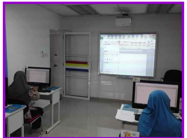
2.1 Peserta sedang mengikuti kelas pengenalan komputer.