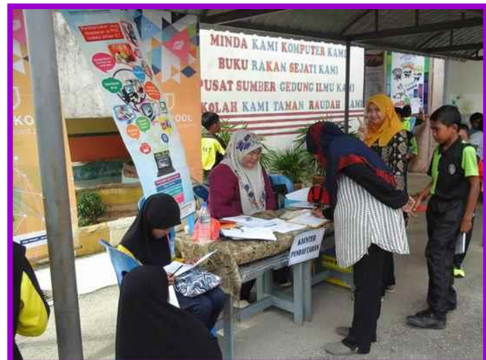
3.1 Peserta sedang mengikuti Taklimat Advokasi dan Bengkel Klik Dengan Bijak