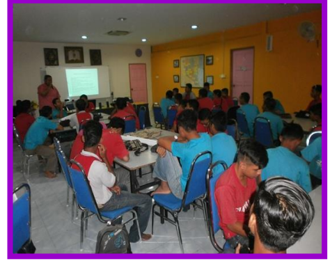
6.1 Peserta sedang mengikuti program INTEL Asas Keusahawanan