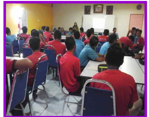
5.1 Peserta sedang mengikuti kelas keusahawanan