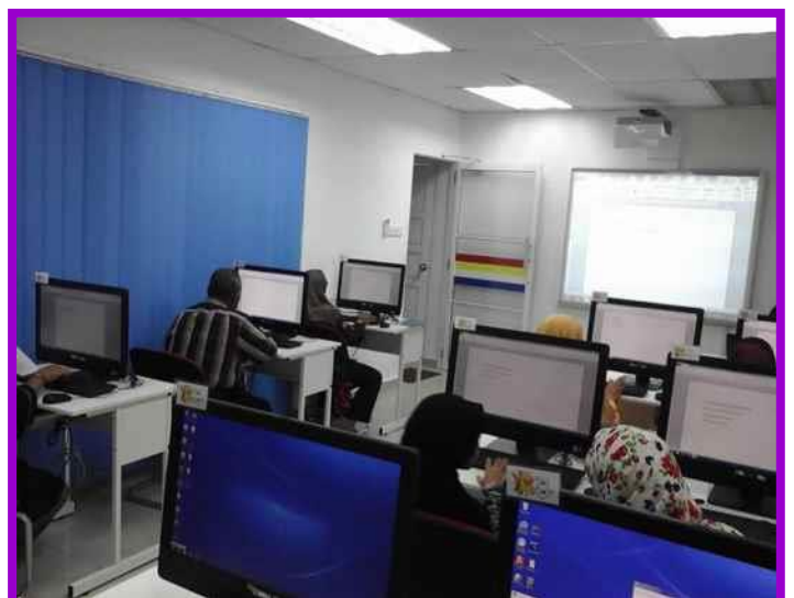
4.1 Peserta sedang mengikuti kelas peta minda colourfull dan Microsoft office Word 2010.