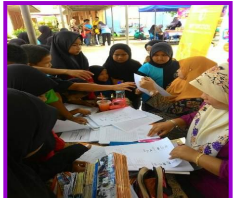
1.1 Peserta sedang mengikuti program e-pembelajaran.