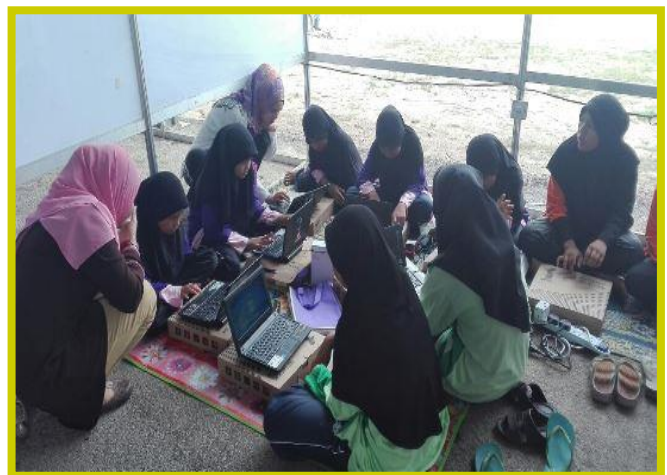
2.1 Peserta sedang mengikuti program Advokasi Klik Dengan Bijak di Pameran Pesta Pantai dari 18 – 25 September 2016