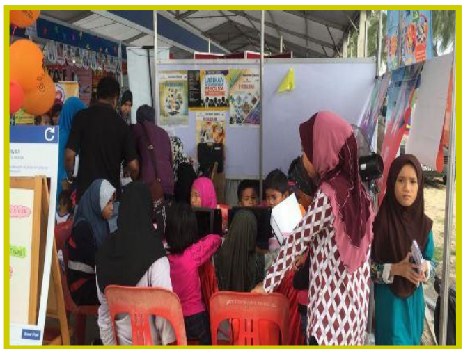
1.1 Peserta sedang mengikuti program e-pembelajaran di Pameran Pesta Pantai dari 18 – 25 September 2016