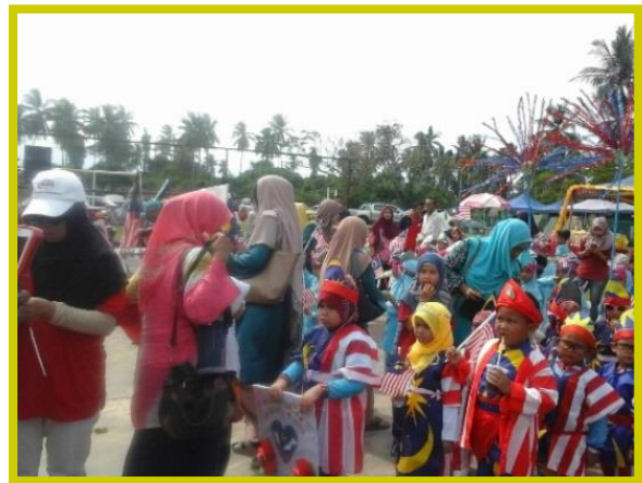
2.0 Peserta sedang mendengar taklimat advokasi klik dengan bijak.